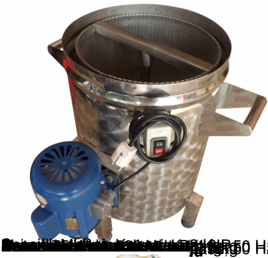
Siemens Hydro 1/2000/45/55 50 Hz