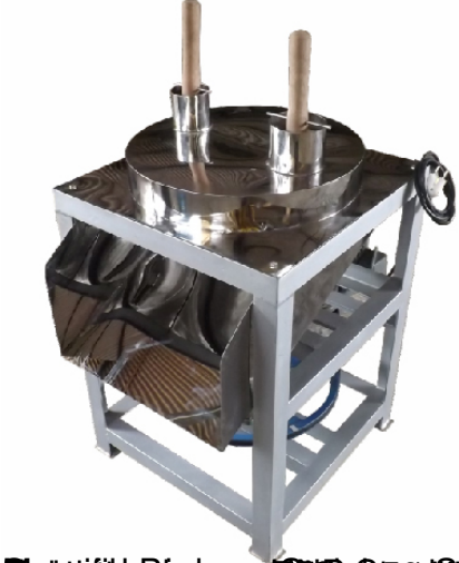
Siemens Hydro 1/2000/45/55 1mm