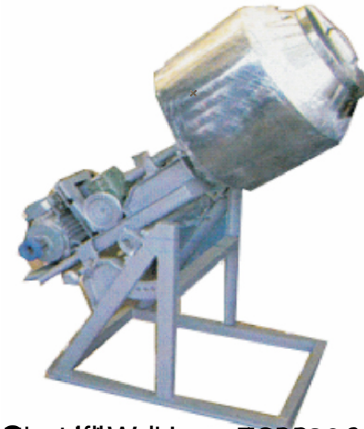
Siemens Hydro 1/2000/45/55 Centric