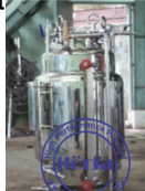
Capacity (kg) : 500-1000 kg/hour (width) : 450 mm (height) : 1000 mm (power) : 1.5 Kw