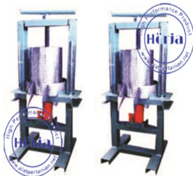
Capacity (kg) : 500-1000 kg/hour (width) : 450 mm (height) : 1000 mm (power) : 1.5 Kw