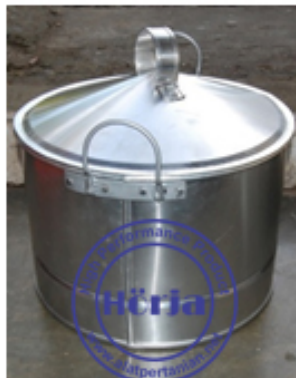
Capacity (kg) : 500-1000 kg/hour (width) : 450 mm (height) : 1000 mm (power) : 1.5 Kw