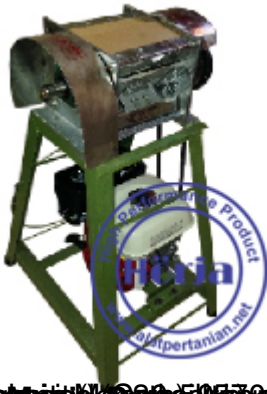
Capacity (kg) : 500-1000 kg/hour (width) : 450 mm (height) : 1000 mm (power) : 1.5 Kw