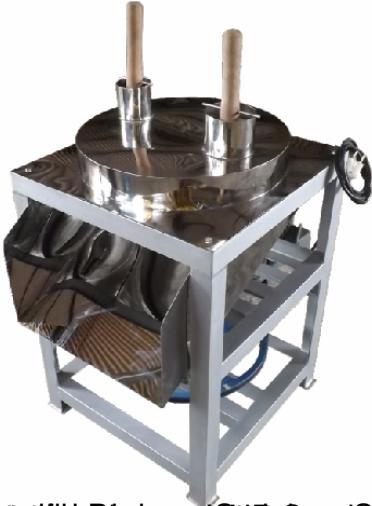
1000 W, 220 V, 50 Hz