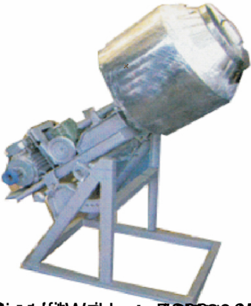
1000 W, 220 V, 50 Hz