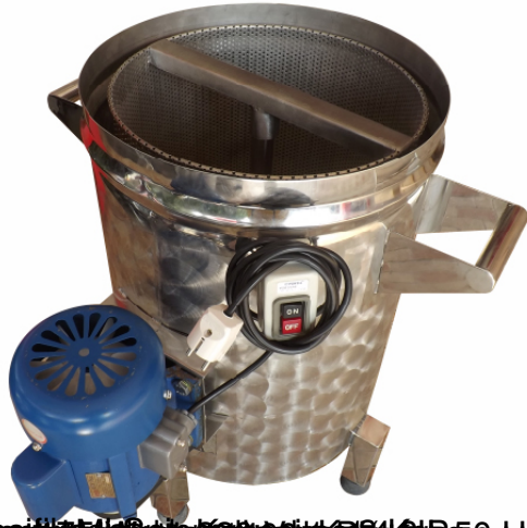
1000 W, 220 V, 50 Hz