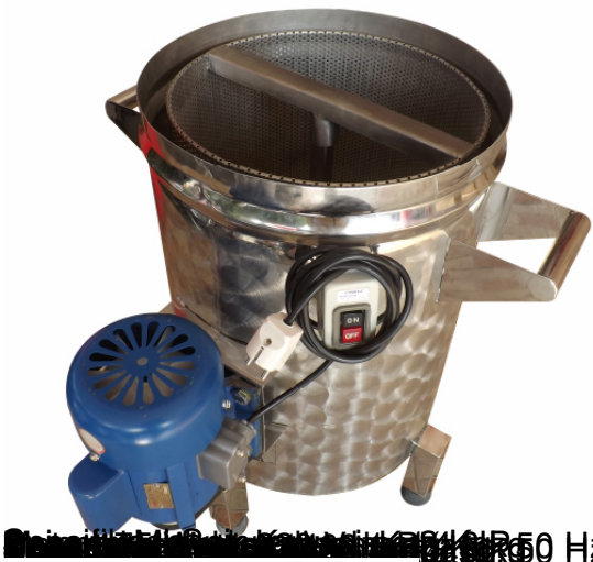
Stainless Steel Vacuum Fryer 10L 220V 50 Hz